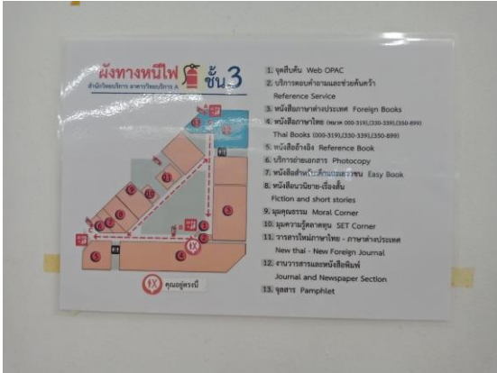
ภาพตัวอย่างผังหนีไฟ ชั้น 3 จุดที่ 1 บริเวณจุดบริการสืบค้นสารสนเทศ Web OPAC

บริเวณชั้น 3 มีการติดผังหนีไฟ 3 จุด คือ 1) บริเวณจุดบริการสืบค้นสารสนเทศ Web OPAC 2) บริเวณที่นั่งอ่านด้านหน้างานวารสารและหนังสือพิมพ์ 3) มุมความรู้ตลาดทุน Set Corner