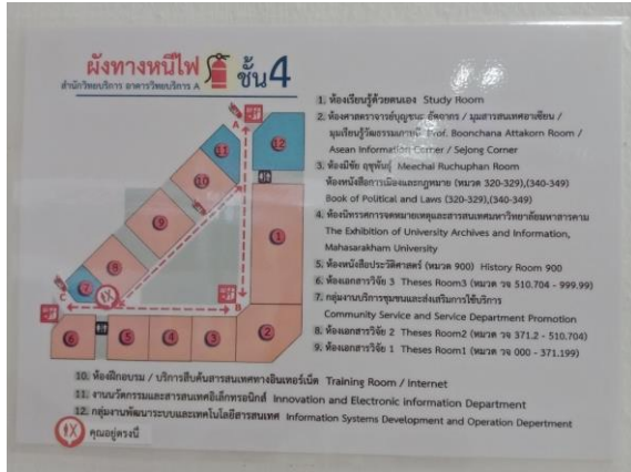
ภาพตัวอย่างผังหนีไฟ ชั้น 4 จุดที่ 1 หน้าห้องเอกสารวิจัย2

บริเวณชั้น 4 มีการติดตั้งหนีไฟ 3 จุด คือ 1) หน้าห้องเอกสารวิจัย2 2) หน้าห้องฝึกอบรม 3) หน้าห้องมีชัย ฤชุพันธุ์